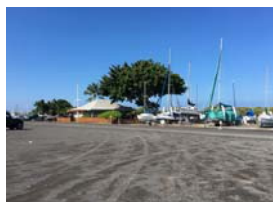
(左がホノコハウハーバー入り口。右が集合場所です。)